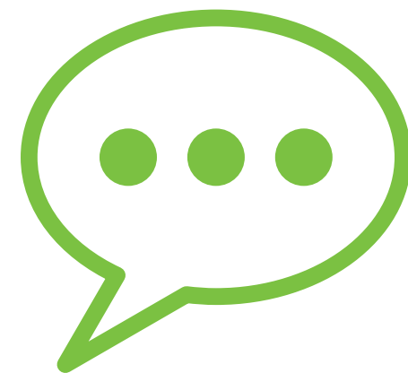
Canales de Comunicación

A continuación, me permito dar a conocer los canales de comunicación establecidos por la Biblioteca , a través de los cuales se podrá acceder a los recursos y servicios de manera virtual :